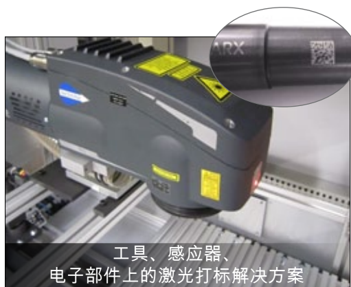
工具、感应器、电子部件上的激光打标解决方案