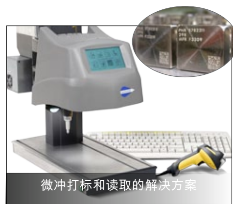
微冲打标和读取的解决方案

关于泰尼福... 泰尼福是世界首家打标机生产商，在金属和塑料工件上永久打标并追溯。